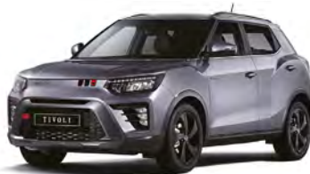
Metalická farba IRON kovová (ADE)