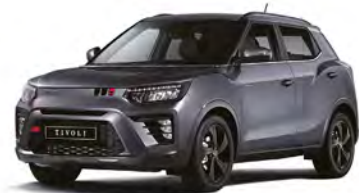
Metalická farba PLATINUM šedá (ADA)