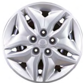
16" oceleové disky s pneumatikami 205/65R