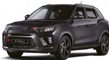
Metalická farba SPACE čierna (LAK)