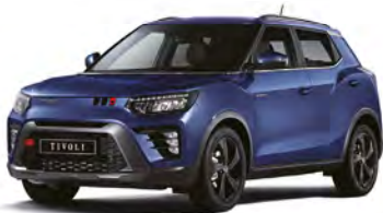
Metalická farba DANDY modrá (BAS)