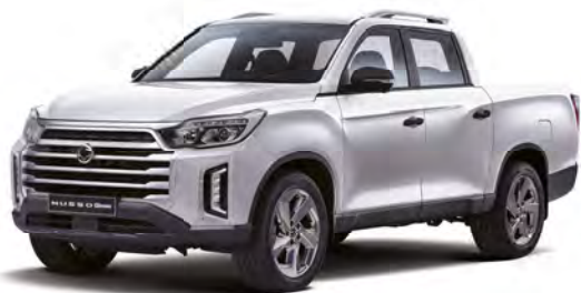
Základná farba GRAND biela (WAA)