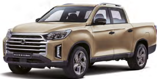
Metalická farba SAND béžová (EBK)