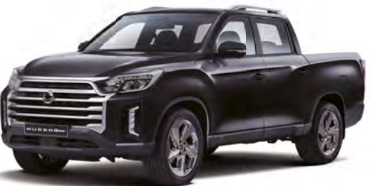
Metalická farba SPACE čierna (LAK)