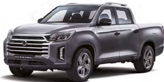
Metalická farba MARBLE graťová (ACM)