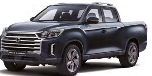
Metalická farba GALAXIES šedá (ADB)