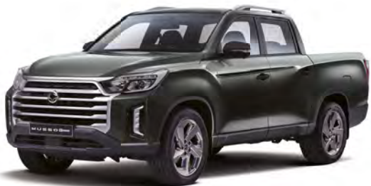
Metalická farba AMAZONIA zelená (GAM)