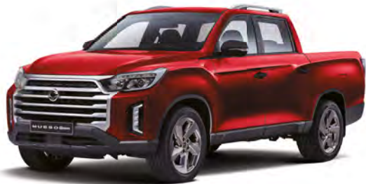
Metalická farba INDIAN červená (RAJ)