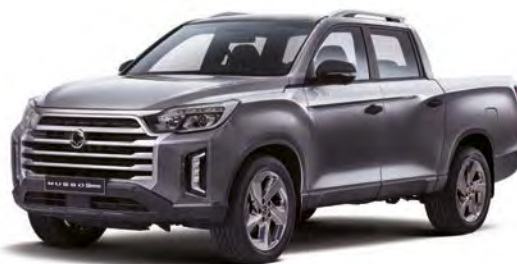
Metalická farba MARBLE grafi tová (ACM)