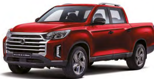
Metalická farba INDIAN červená (RAJ)