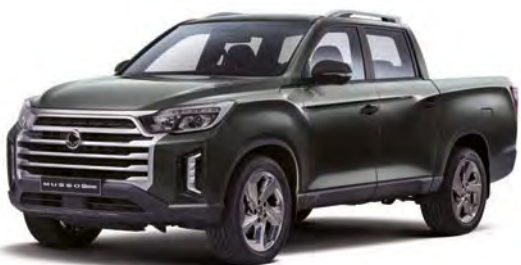
Metalická farba AMAZONIA zelená (GAM)