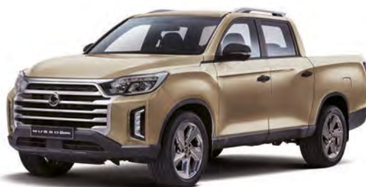
Metalická farba SAND béžová (EBK)