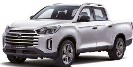
Základná farba GRAND biela (WAA)