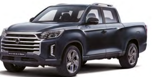
Metalická farba GALAXIES šedá (ADB)