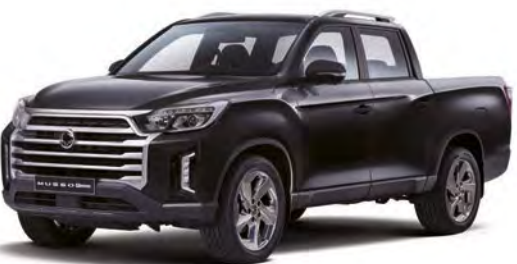
Metalická farba SPACE čierna (LAK)