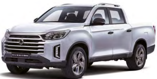
Metalická farba PEARL biela (WAK)