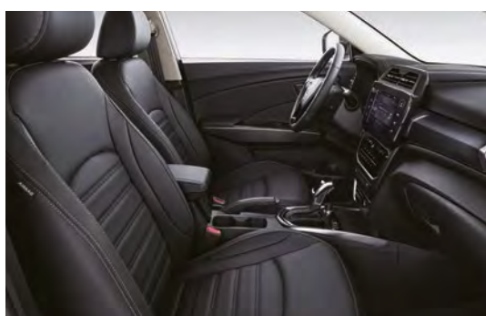
Čierny interiér (LBH)*

*Foto je iba ilustratívne, na slovenskom trhu je v ponuke iba textilný potah sedadiel.