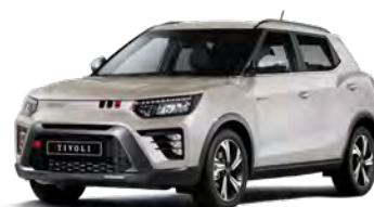
Metalická farba LATTE béžová (EBL)