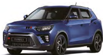
Metalická farba DANDY modrá (BAS)