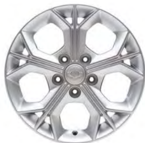
16" ALU disky, pneumatiky 205/65 R16