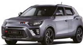
Metalická farba IRON kovová (ADE)