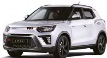
Základná farba GRAND biela (WAA)