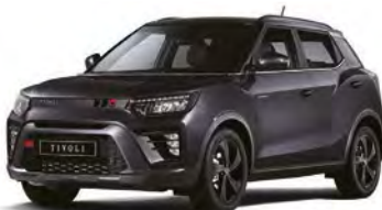
Metalická farba SPACE čierna (LAK)