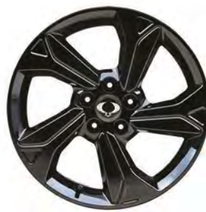
18" čierne ALU disky "Diamond Cutting", pneumatiky 215/50 R18