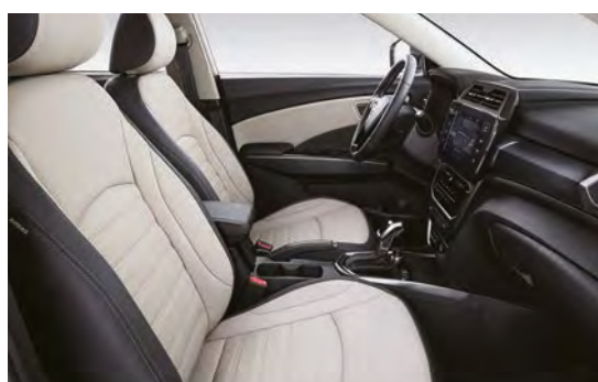
Svetlošedý dvojtónový interiér (EBG)*

*Foto je iba ilustratívne, na slovenskom trhu je v ponuke iba textilný potah sedadiel.