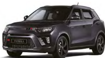
Metalická farba SPACE čierna (LAK)