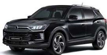
SPACE čierna (LAK)