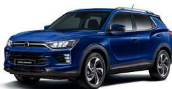
DANDY modrá (BAS)