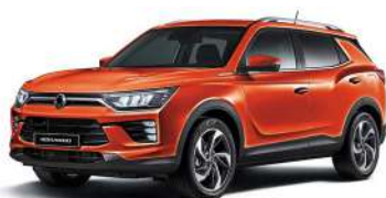
REDDISH oranžová (RAT)