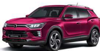
CHERRY červená (RAV)