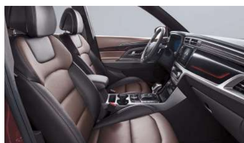
Hnedý kožený paket (OAY)