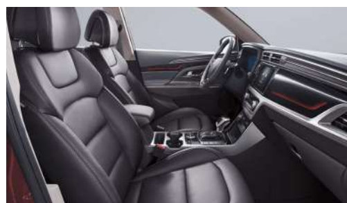
Čierna interiér (LBH)