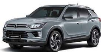
PLATINA šedivá (ADA)