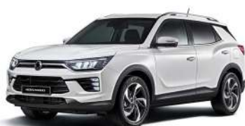
GRAND biela (WAA)